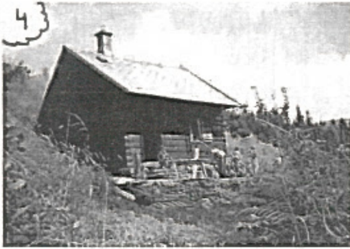
ST..... 1993 - DODNE